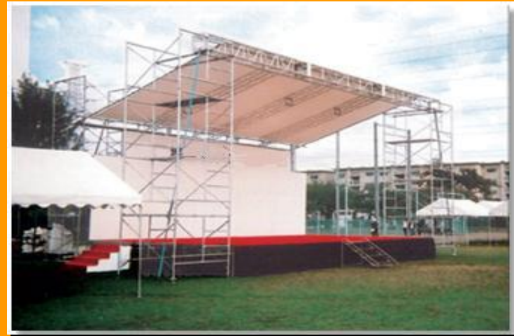
メインステージ(イメージ)

協賛: 関西電力(株)、パナソニック(株)、サッポロビール(株)、シャープ(株)、京セラ(株)、オムロン(株)、伊藤忠商事(株)、ヤンマー(株)、(株)間口、ダイキン工業(株)、日本電産(株)、丸紅(株)、(株)ユニクロ、全日本空輸(株)(順不同・一部依頼中)